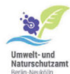
Umwelt- und Naturschutzamt Berlin-Neukölln