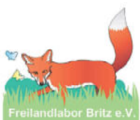
Freilandlabor Britz e.V.