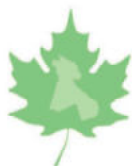
Koordinierungsstelle Umweltbildung Neukölln